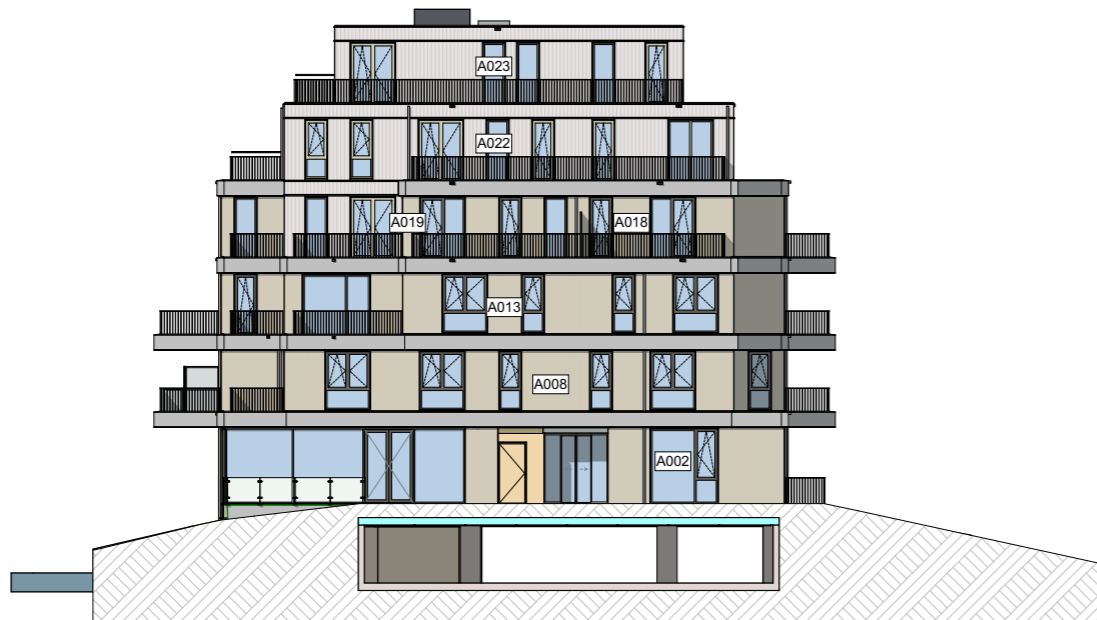
De Kade - Zuidgevel A

18.720 06 zesde verdieping 15.660 05 vijfde verdieping 12.600 04 vierde verdieping 9.540 03 derde verdieping 6.480 02 tweede verdieping 3.420 01 eerste verdieping 0 00 begane grond -3.060 -1 kelder