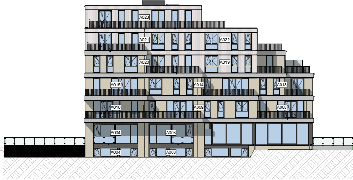
De Kade - Westgevel A-B

18.720 06 zesde verdieping 15.660 05 vijfde verdieping 12.600 04 vierde verdieping 9.540 03 derde verdieping 6.480 02 tweede verdieping 3.420 01 eerste verdieping 0 00 begahe grond