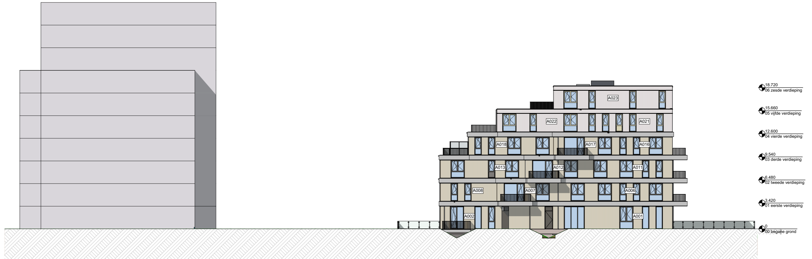
De Sluis - Oostgevel A-B