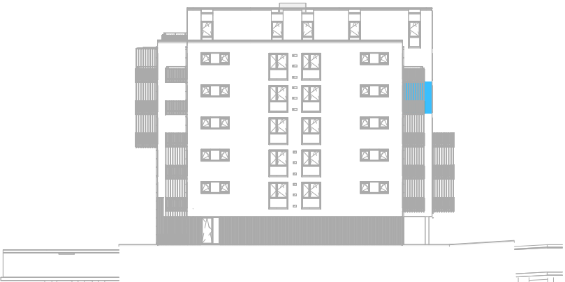
Achtergevel Oost schaal: 1 : 500