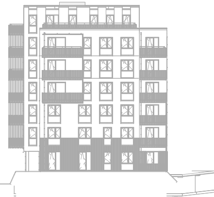
Rechter zijgevel Zuid schaal: 1 : 500