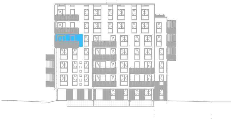
Voorgevel West schaal: 1 : 500