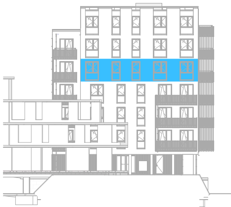
Linker zijgevel Noord schaal: 1 : 500