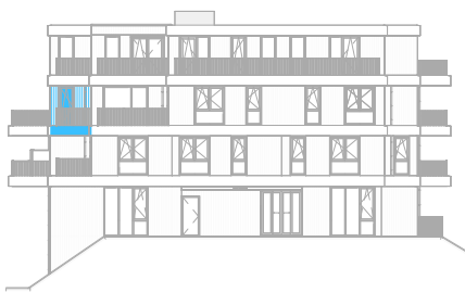
Rechter zijgevel Zuid schaal: 1 : 500