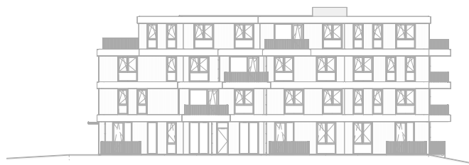
Achtergevel Oost schaal: 1 : 500