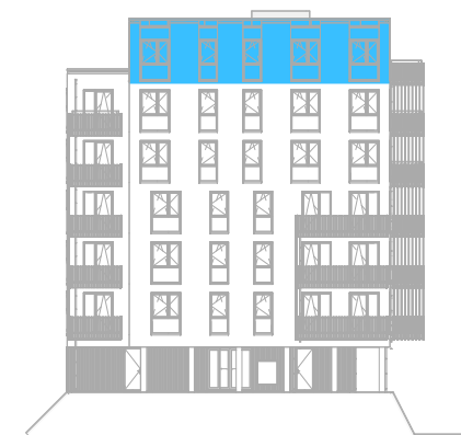
Linker zijgevel Noord schaal: 1 : 500