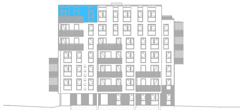
Voorgevel West schaal: 1 : 500