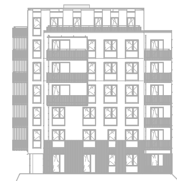
Rechter zijgevel Zuid schaal: 1 : 500