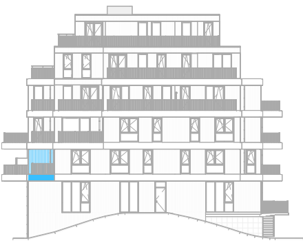
Rechter zijgevel Zuid schaal: 1 : 500