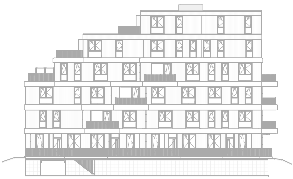
Achtergevel Oost schaal: 1 : 500