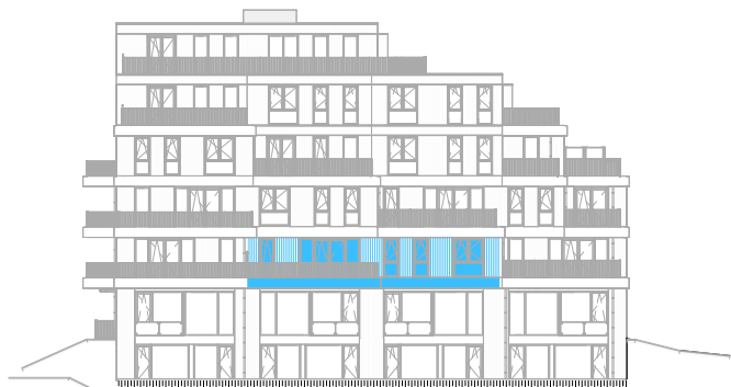
Voorgevel West schaal: 1 : 500