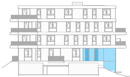
Linker zijgevel Noord schaal: 1 : 500