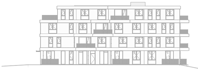
Achtergevel Oost schaal: 1 : 500