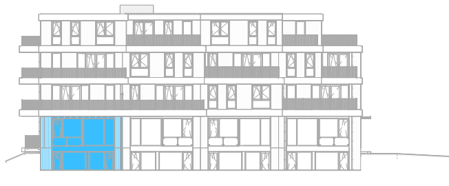
Voorgevel West schaal: 1 : 500