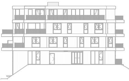
Rechter zijgevel Zuid schaal: 1 : 500