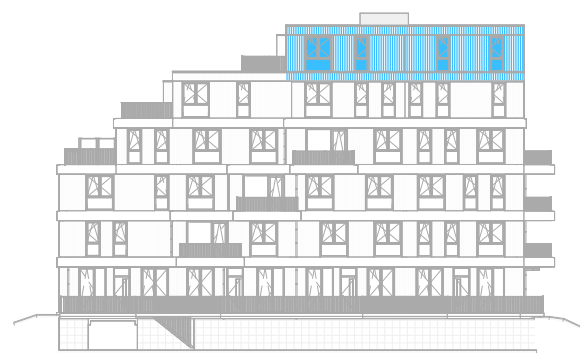
Achtergevel Oost schaal: 1 : 500