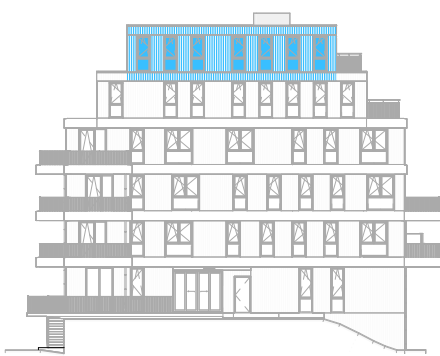
Linker zijgevel Noord schaal: 1 : 500