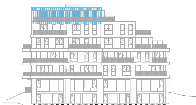
Voorgevel West schaal: 1 : 500