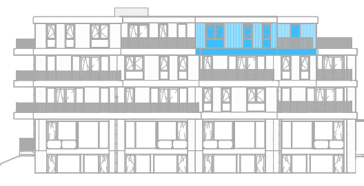
Voorgevel West schaal: 1 : 500