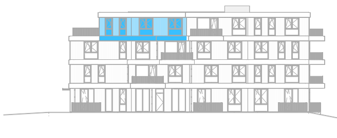
Achtergevel Oost schaal: 1 : 500