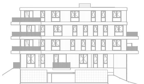
Linker zijgevel Noord schaal: 1 : 500